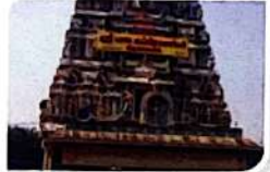
Siruvapuri Murugan Temple