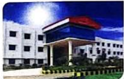
T.J.S Engg. College & School