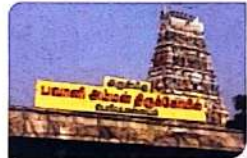
Bhavaniamman Temple Periyapalayaam