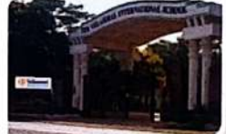
VELAMMAL EDUCATION TRUST