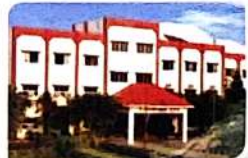
R.M.K School & Engg. College