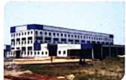
Sheenlac Paints Factory